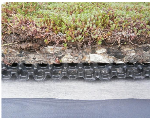
Obr.: Rez ľahkou extenzívnou vegetačnou strechou STERED